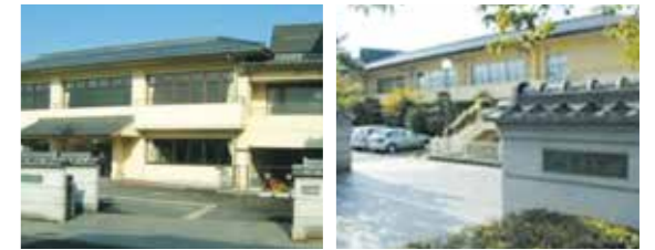
ボランティアセンター 東福祉センター

開所時間：9時～17時 休業日：日曜日・月曜日・祝日の翌日 年末年始(12月29日～1月3日)