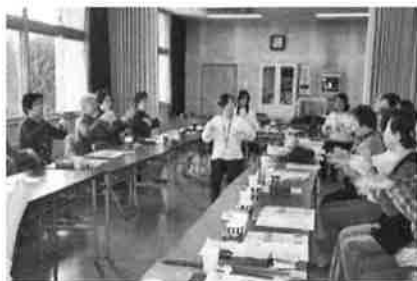
サロンで介護予防ストレッチ体操

また、スタッフ会議の検討により、おしゃべりだけでは物足りない方も、のこととも考え、学習会や創作活動など毎回テーマを設け、飽きがこないサロン運営にも心がけておられます。