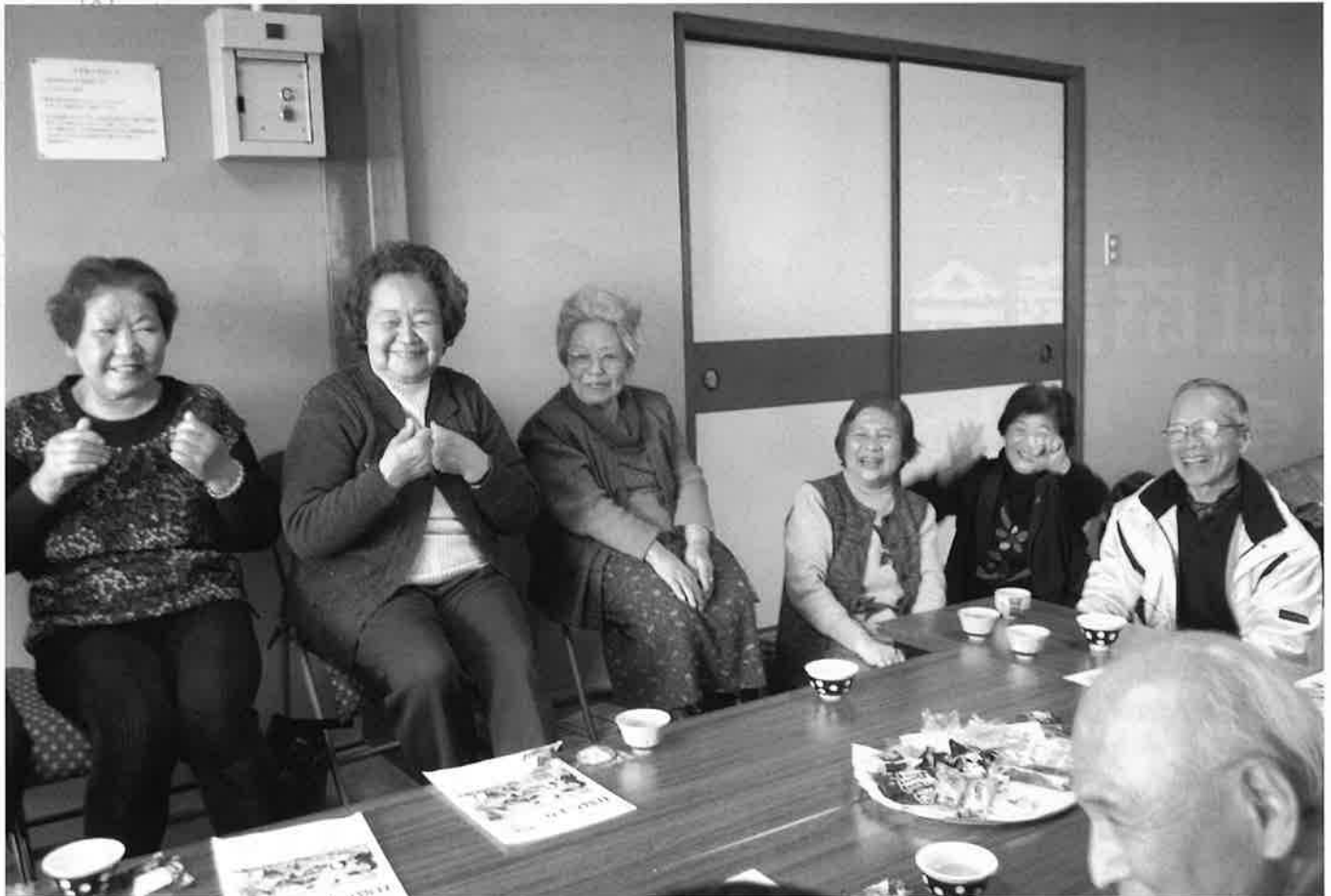
地域は元気の源! 鶴舞地区のつるまい団地見守りネットワーク「おしゃべりカフェ」より