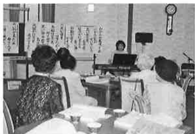
独居高齢者の会食懇親会

近鉄学園前駅南側に位置する学園南地区は、開発より60年が経過し第3種風致地区として保全されている、閑静な住宅地区です。少子高齢化など様々な課題を抱えています。平成22年に地区福祉活動計画を策定し、「ふれあいを深め 支え合えるまちづくり」をキャッチフレーズに、地域の課題解決に向けての取り組みを進めています。