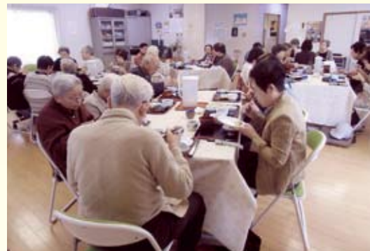
▲ ふれあいサロンの様子

右京地区では、夏祭りや運動会といった地域住民がふれあう機会が少なくなりました。そのような中、「われもこう」は地域住民が気軽に集える場としての「ふれあいサロン」を展開しています。右京地区社協主催で行なっている「水曜喫茶室」は、地域住民が気軽に集える場をもっと増やしたいという地区社協の思いからこのふれあいサロンがきっかけとなってはじまりました。地区ボランティアが行う「ふれあいサロン」と地区社協が行う「水曜喫茶室」のスタッフは、お互いに協力し、助け合いながら活動を進められています。