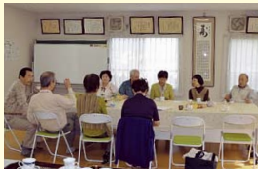
▲ 水曜喫茶室の様子