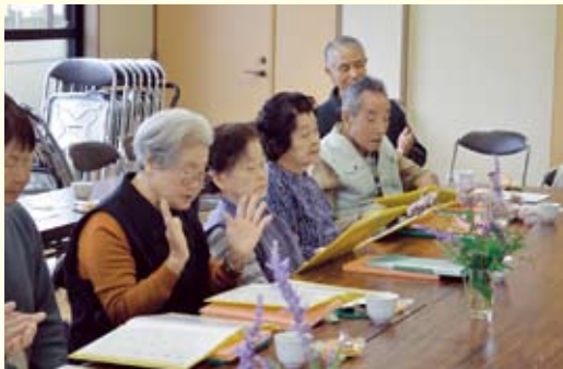
▲手作り歌集を見ながら唱っている様子