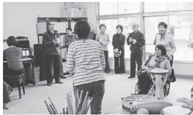
音楽療法を取り入れた活動（鳥見デイサービスセンター）