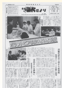
奈良市民だより 昭和61年6月15日号