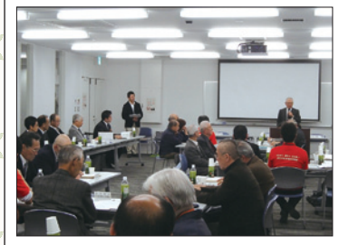
フォーラム終了後、同日に行われた「地区社協会長会第2回会長会」でも、フォーラムの内容を振り返り、活発な意見交換が行われました。

当日は、地域で福祉活動を実践されている方をはじめ、各種団体の役員やボランティア、見守り協定事業者(企業)など約180名が参加。地域福祉の推進に向けて、行政が基盤整備や仕組みづくりを進め、民間の立場からは、本会が推進主体となって地域課題の解決に向けた地域福祉実践を進めいくことを共有しました。