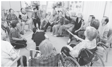
都祁福祉センターデイサービス