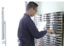
書類整理ボックス (赤い羽根共同募金の助成金で購入)

A. ひきこもりの方の相談では、家族に見学に来てもらい、良ければ本人に勧めてもらっています。その中で、家族と本人の関係への助言など、家族に対する支援が必要な現状を感じていますが、時間や人材が限られている中でどのように取り組めるのか、検討中です。また、財源確保の問題もあります。パソコン、テーブルなど訓練用の備品は赤い羽根共同募金の助成金を活用させていただき、利用者の作業・訓練内容の充実を図っています。