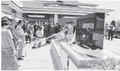
福祉作業所開所式（昭和60年）