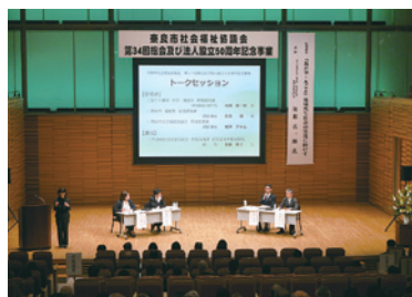
トークセッション