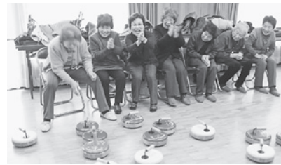
月ヶ瀬福祉センター「地区生きがい教室」