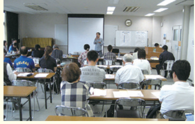
公開プレゼンテーションの様子