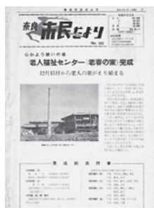
奈良市民だより 昭和43年12月1日号