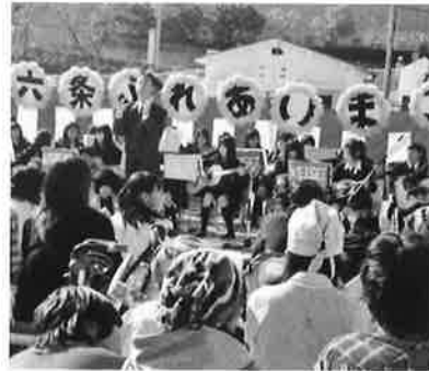
県立西の京高等学校「吹奏楽部」による演奏 (六条ふれあいまつりより)

地域のことを少しでも知っていただきたいとの思いに加え、互いに見える地域社会を作っていききたいという地元関係者の思いや願いが形となった「六条ふれあいまつり」。この活動は、地域住民誰もが参加することができ、地域内にある福祉施設や教育機関、自治連合会など各種団体との協働による手作りのフェスティバルとして、6年目を迎えた。