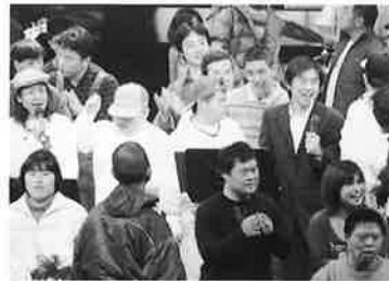
春咲きコンサートの様子

また、ライブやコンサートには奈良市以外からの参加者も増えてきています。こういった活動が他の地域に根付いていくことで障がい福祉の幅が広がっていくことに喜びを感じています。