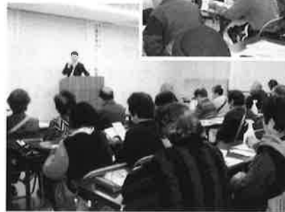
みんなで学ぶ介護保険制度(学習活動より)