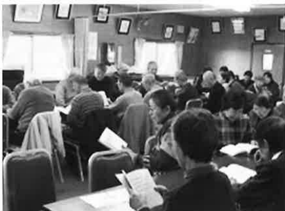
梅ヶ丘サロン(歌の練習より)

サロンは月1回第3水曜日に実施され、参加者は45〜55人。十数年前より有志で開催されています。年齢制限はなく、ここ2〜3年で参加者が増えていきます。活動は季節行事のほかに音楽活動、特に歌の練習をしています。練習成果を発表する場合は、町内の方々が集まる公民館まつりで披露し、祭りを盛りあげています。