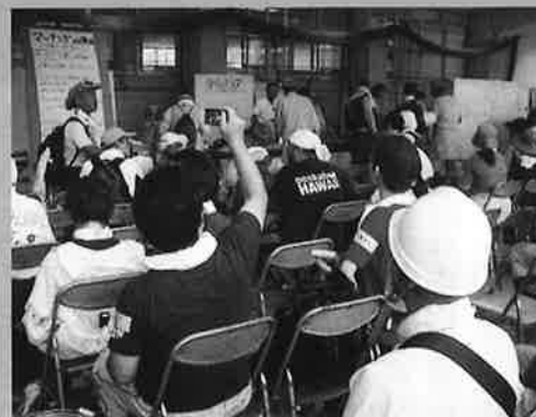
兵庫県佐用町での災害ボランティアセンターの様子

当協議会でも、防災活動への普及啓発とともに、災害ボランティアセンターの機能充実に向けて取り組みを進めていきます。