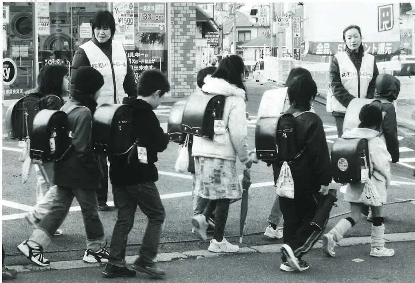
富雄地区通学路防犯パトロール ～地域で取り組む安全・安心のまちづくり～