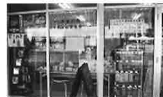
入り口には、子どもたちが興味を引くカードやファイルが陳列しており、誰もが入りやすい雰囲気

県内の若年認知症の方の実態が把握される事により、認知症の専門相談窓口や医療関係との連携と、その方たちの居場所づくりがより一層必要になってくると考えられます。