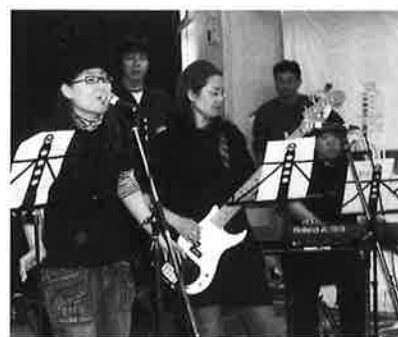
施設訪問コンサートの様子

Q 活動を通して感じることや知ってもらいたいことは？ A 音楽には人を夢中にさせるエネルギーがあります。ライブの中で見られる参加者の『目の輝き』は、施設や家庭の生活の中ではなかなか見られません。私たちのライブに参加していただいて、その『目の輝き』を実際に見て、何かを感じてもらえればと思います。