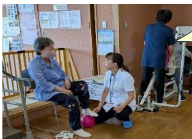
ゴムボール訓練で 無理なく体幹強化

体操や個別機能訓練・・・お一人ひとりの身体状況に合わせ、機能訓練指導員(理学療法士、看護師)が心身状況や生活機能の維持・向上を目的にプログラムを決め実施・評価を行います！