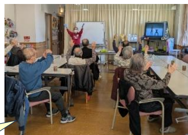
みんなで楽しみながら ビデオ体操！